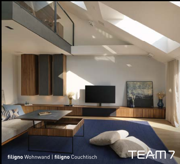
filigno Wohnwand | filigno Couchtisch

Und zwar exakt nach Ihren Wünschen – mit Möbeln von TEAM 7. Echtes Holz sorgt für Belastbarkeit, Langlebigkeit und ein angenehmes Raumklima. Modernste Technik und innovative Funktionen verwandeln Ihr Wohnzimmer im Nu in ein Home Office oder ein Multimediacentrum, spannende Momente inklusive. Ganz wie Sie wünschen!