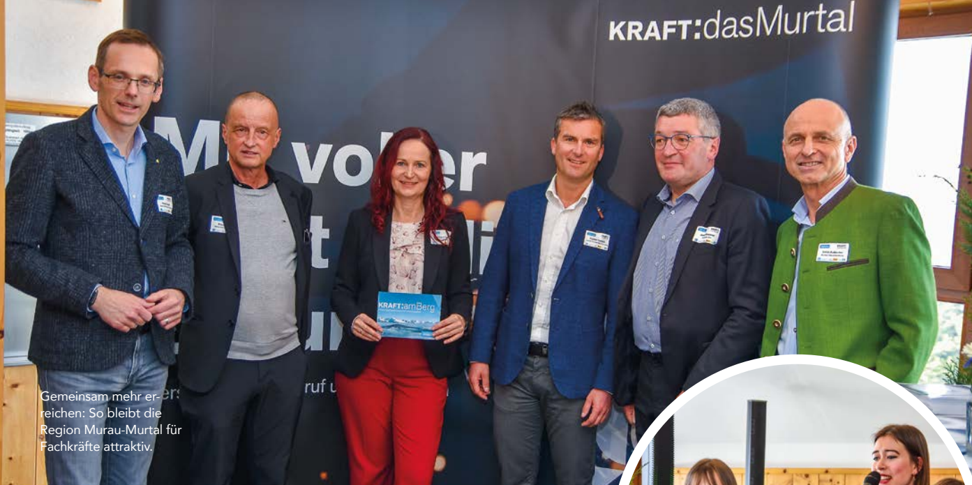
Gemeinsam mehr erreichen: So bleibt die Region Murau-Murtal für Fachkräfte attraktiv.