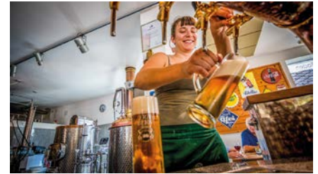
Der Sudkessel ist als Schaubrauerei im Gastraum platziert, Sudhaus und Gärkeller befinden sich ein Geschoss tiefer.