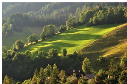
Der Wald als Rückzugsgebiet für Stressgeplagte.