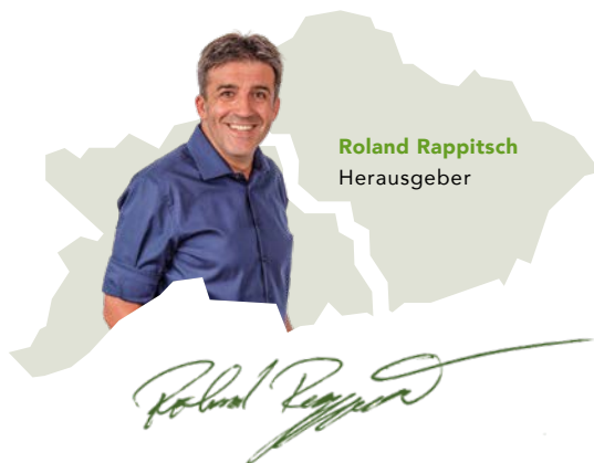
Roland Rappitsch Herausgeber

Die top Anlaufstelle für Highspeed-Internet-Verbindung ist AiNet. Gerade in den vergangenen Jahren haben wir das Internet und seine Vorzüge zu schätzen gelernt. Privat sorgt es für Unterhaltung und das Aufrechterhalten von Kontakten, beruflich ist es eine Erleichterung und ermöglicht uns eine freie, weitgehend ortsunabhängige Arbeitsweise. Kurz gesagt, es ist aus unserem Leben nicht mehr wegzudenken. Dem Tochterunternehmen der Stadtwerke Judenburg verdanken wir, dass wir in der Region und darüber hinaus so gut verknüpft sind. Zum 25-jährigen Jubiläum wird ein Blick zurück und in die Zukunft geworfen.