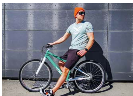
WOOM begeistert Groß und Klein.

Die traditionelle Hausmesse in Murau findet diesmal gleich an zwei Tagen statt. Ganz besonders im Fokus steht das