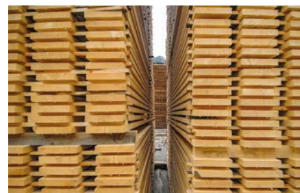
Holz ist ein wichtiger regionaler Wirtschaftsfaktor.