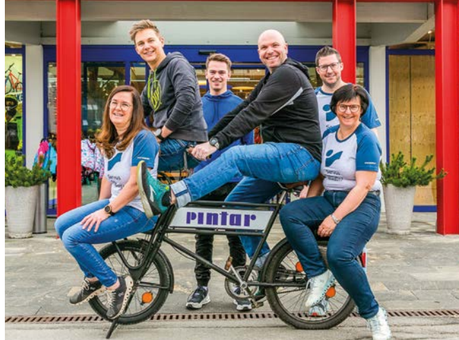
Die Freude beim Biken ist für das Pintar-Team beinahe eine Lebensphilosophie.

Neuaufgabe der großen Intersport Pintar Hausmesse: Am 14. und 15. April gibt's tolle Schnäppchen und vieles mehr.