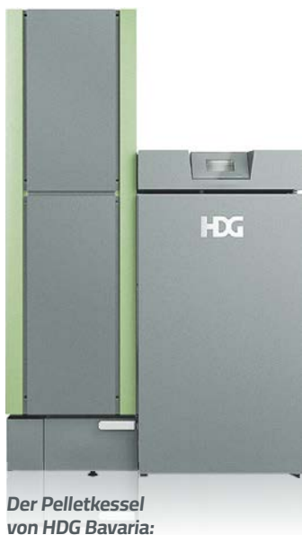
Der Pelletkessel von HDG Bavaria: Clever, effizient, komfortabel und flexibel

Frühbucher-Bonus: jetzt Preisgarantie nützen!