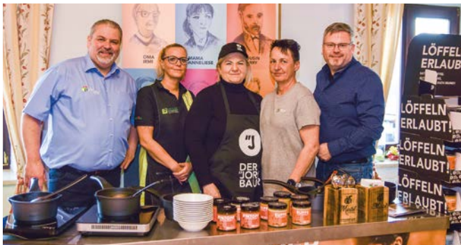
Unternehmen werben auf der Job-Convention für sich – und das mit Erfolg.

Batterien und Akkus sind aus unserem Leben nicht mehr wegzudenken. Doch jede zweite Batterie wird falsch entsorgt. Über 850 Tonnen in Österreich landen jedes Jahr im Restmüll, obwohl alte Batterien kostenlos in den Sammelboxen im Handel oder in den Abfallsammelzentren zurückgegeben werden können. Anlässlich des Welttages der Batterie rief Saubermacher gemeinsam mit dem Dachverband der steirischen Abfallwirtschaftsverbände zur richtigen Mülltrennung auf. „Die EU-Batterieverordnung sieht verpflichtende Rückgewinnungsquoten und den Einsatz von Recyclingrohstoffen vor. Saubermacher bereitet sich schon jetzt darauf vor“, so Saubermacher-Gründer Hans Roth.