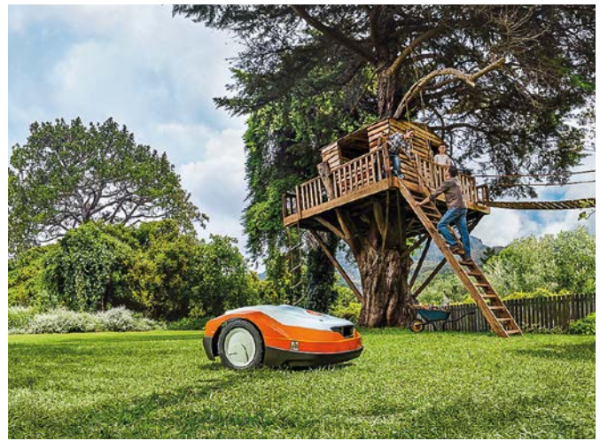
Die Motorwelt Spindelböck gilt als Pionier auf dem Sektor von Mährobotern. Das umfassende Sortiment bietet für jedes Grundstück eine optimale Lösung.