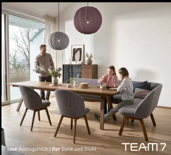
taso Auszugstisch | flor Bank und Stuhl