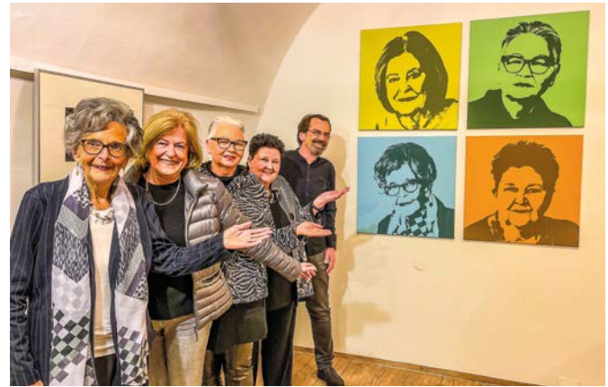
Each for Equal wurde am 8. März eröffnet.

www.kaltenegger-firmengruppe.at www.paka.at