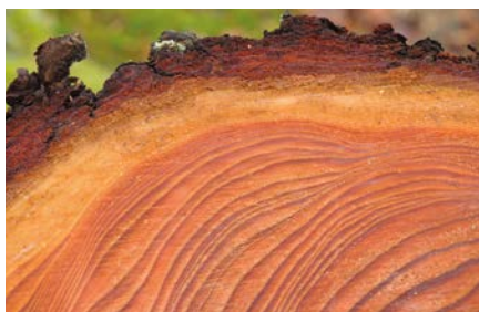
Nur anpassungsfähige Bäume können alt werden.

Die Bezirke Murau und Murtal gehören zu den waldreichsten der Steiermark. Der Klimawandel zeigt allerdings bereits spürbare Auswirkungen auf die Forstwirtschaft. Von der Wissenschaft wird vor allem mehr Laubholz gefordert. Ein Projekt, das die Holzwelt Murau in diesem Zusammenhang gestartet hat, nennt sich „Lärche offensiv“. Ihr soll in Zukunft eine wichtige Rolle zukommen, da sie anpassungsfähiger und widerstandsfähiger gegenüber Trockenheit ist als die Leitbaumart Fichte.