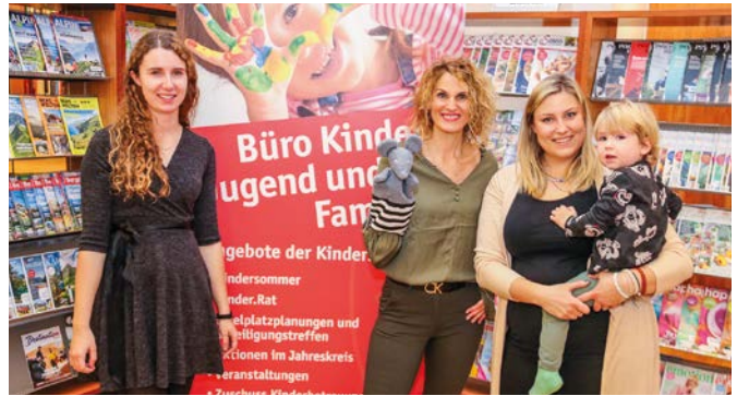
Der Mäusetreff in der Stadtbibliothek: beliebter Treffpunkt für Mütter und Kids.