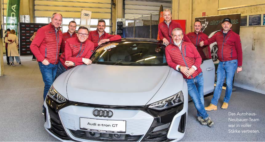
Das Autohaus-Neubauer-Team war in voller Stärke vertreten.