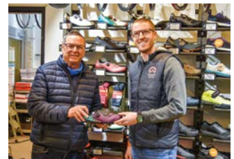
Bei der Eröffnungsfeier war ganz schön was los: Einsteiger wie Profis überzeugten sich selbst vom neuen Rad-Geschäft in der Knittelfelder Frauengasse.