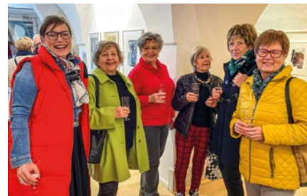
Zahlreiche Freunde und Ehrengäste folgten der Einladung.