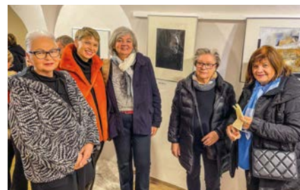
Öffnungszeiten: Do. 16-18 Uhr, Fr. u. Sa. von 10-12 Uhr.