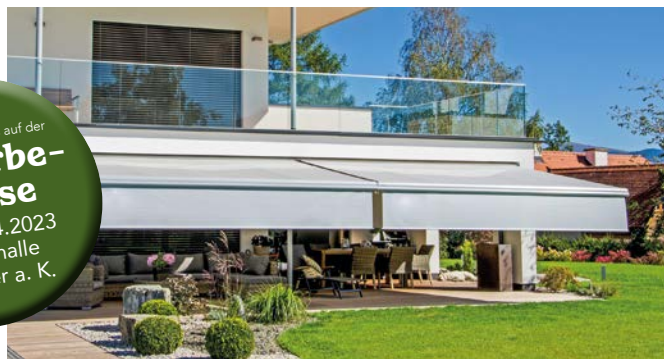
Das kostbare Sonnenlicht wird bestmöglich für Ihr Zuhause dosiert.

Die breite Produktpalette der Gebrüder Hirschbeck bietet für jede Raumsituation maßgeschneiderte und ganzheitliche Lösungen in den Bereichen Sonnenschutz, Sichtschutz und Insektenschutz. Mit einer Gelenkarm-, Wintergarten- oder Fassaden-Markise und einer optionalen Seitenschutzwand vergrößern Sie Ihren Wohnraum nicht nur optisch, sondern nutzen die Vorteile einer außenliegenden textilen Beschattung. Durch die exklusive Farbvielfalt sowie hochmoderne Dekore und Strukturen werden Phantasie und Gestaltungskraft beflügelt. Die Steuerungssysteme der Gebrüder Hirschbeck bieten für jeden Anwendungsbereich perfekten Komfort.