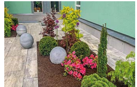
Gute Gartengestaltung erfordert viel Know-how.

sich zudem Gartengeräte, Baumaschinen und Werkzeug ausborgen.