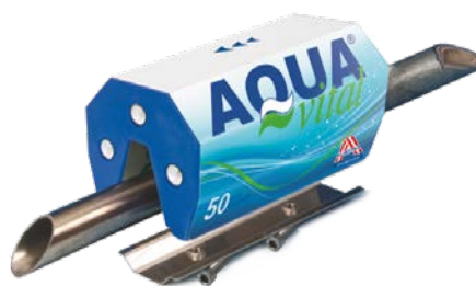
Aquavital sorgt für sparsamen Umgang mit Wasser.